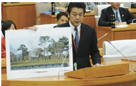
平成24年12月定例会本会議

平成24年12月定例会本会議において「安価で、近くで、見守りの心配がない」さいたま市議会で初めて「市営霊園内に樹林型合葬式墓地の整備」を提案!!市は「研究会を設置し研究する」と回答。